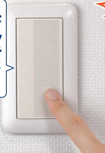
※製品の特性上、シールは薄く茶色がかった透明です。