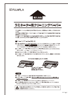
ラミネーター内部のローラー清掃に!