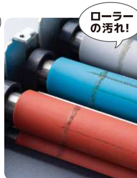
ラミネーター内部イメージ