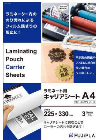
▲パッケージイメージ