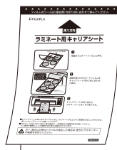
◀ キャリアシート ×3枚

■ 価格: オープン ■ JAN: 4902668631403 ■ 出荷単位: 1